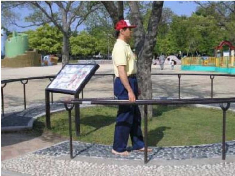
足つぼサークルの様子