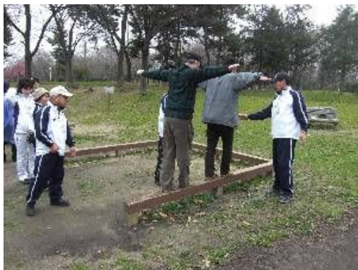
【ふらつかないうんどう】

腰痛予防には、腹筋や背筋を鍛えて、筋肉のコルセットを作りましょう。背筋もピンと伸び、若々しい立ち姿を維持できます。