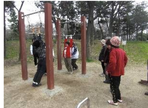
【全身のびのびうんどう】

体の筋肉を鍛えたら、最後には、少し筋肉を楽にしてあげましょう。肩こり予防には、このうんどうが最適です。