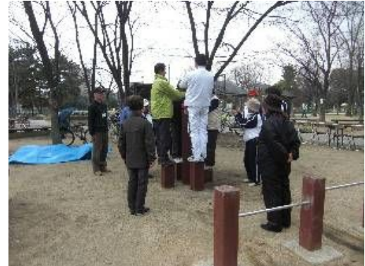
【かいだんうんどう】

人間の一番大きな筋肉は太ももの筋肉です。太ももとお尻の筋肉を鍛えると、階段の上り下りが楽になり、失禁の予防にもなります。