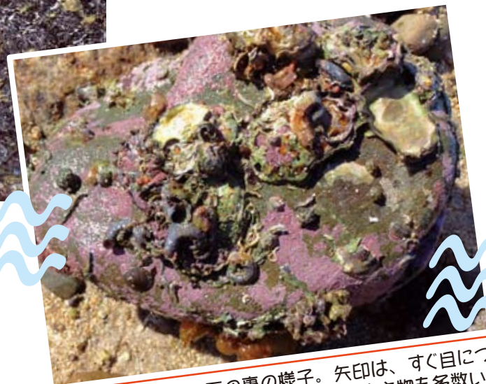
写真3：ひっくり返した石の裏の様子。矢印は、すぐ目についた生き物。他にも写真では見えない小さな生き物も多数いる。