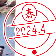
写真1：さとうみ磯浜で磯遊びする人々