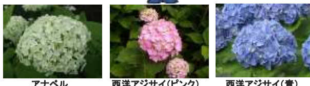
アナベル 西洋アジサイ(ピンク) 西洋アジサイ(青)

名物スポットとして、多くの方々に喜んでいただけるよう、整備を進めていきますので、温かく見守ってあげてくださいね!