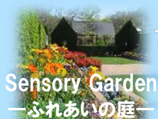
Sensory Garden —ふれあいの庭—