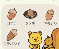
【大泉緑地のドングリ】

大泉緑地には約12種類のドングリが見られます。友達や家族と色々な形のドングリを集めて記録したり、工作したりして楽しんでください。秋にはどんぐりの工作教室も開催しています。