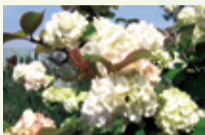
オオデマリ（ふれあいの庭）