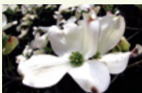
ハナミズキ（ふれあいの庭）

園内のあちこちに咲いている5月の花を満喫できるおすすめコースを紹介。コデマリ（第1駐車場東側園路）～ヒラドツツジ（桜広場南側園路）～カキツバタ（かきつばた園）～ハナミズキ・オオデマリ（ふれあいの庭）～フジ（大パーゴラ）