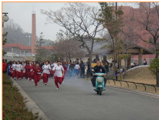
2月10日(水) 大阪府立岬高等学校マラソン