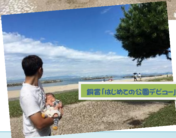
銅賞「はじめての公園デビュー」