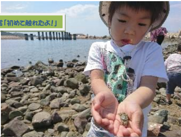
金賞「初めて触れたよ!」