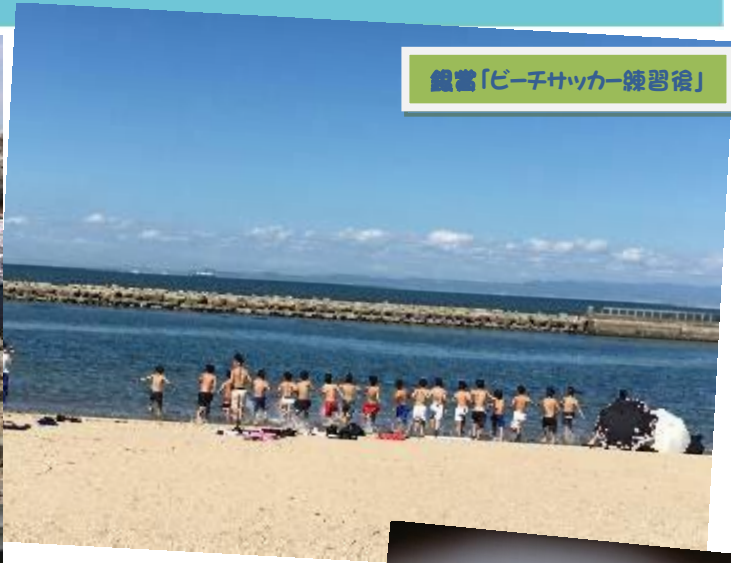
銀賞「ビーチサッカー練習後」