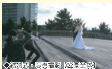
◆結婚式・写真撮影【公園全体】