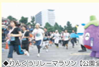
◆りんくうリレーマラソン【公園全体】