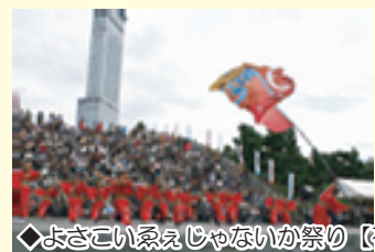
◆よさこい系えじやないか祭り【石舞台】