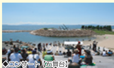
◆コンサート【石舞台】