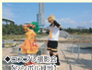
◆コスプレ撮影会 【シンボル緑地】