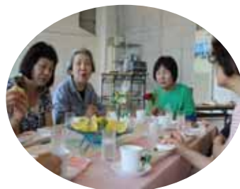
公園スタッフと共に全員集合