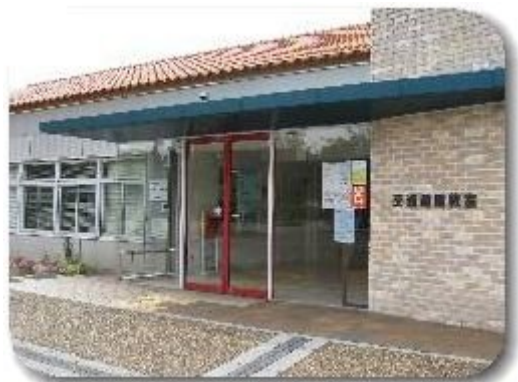
交通指導の映画やビデオの上映