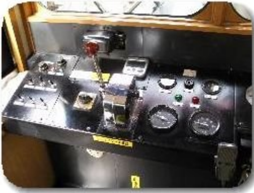
運転席もすごいでしょ