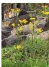
↑この花の名前、ご存知ですか？

突然ですが、クイズです！皆さんは左の写真の植物の名前、何だかわかりますか？ 答えは、オミナエシ！日本～東アジアにかけて分布する毎年花を咲かせる多年草で、漢字表記では「女郎花」と書きます。このオミナエシ、秋の七草の一つなのですが、皆さんは秋の七草全種類言えますでしょうか？ オミナエシ、フジバカマ、クズ、ハギ、ナデシコ、ススキ、キキョウの7種類です。 頭文字をとって「お・ふ・く・は・な・す・き(お福、花好き)」と覚えると覚えやすいそうです。ばら庭園案内倶楽部の方が教えてくれました。無病息災を願って食する春の七草とは違い、眺めたり愛でたりして楽しむのが秋の七草。 その秋の七草ですが、なんと全てばら庭園の中で見つけることができます！ クズは雑草として刈り取られてしまうこともあるそうですが…。 一口に「秋の七草」と言っても開花の時期はバラバラで、一気に花が咲くわけではないのですが、草自体はばら庭園に植わっているので、是非一度さがしてみてください！