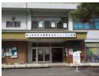
もう迷わせません!!

浜寺公園で屋内イベントを開く際、イベントに参加して下さる方から、「会場の場所が分かりにくい」「管理事務所のほうに行ってしまった」「建物の近くまで来てここが会場とわかりにくかった」というお声を頂くことがたびたびありました。そこで、レストハウス浜寺に掲示するための巨大看板を作成しました! 2月14日(日)の「浜寺公園歴史・文化フォーラム」「みつけよう! チリメンモンスター」の開催日にお披露目となり、当日来て頂いた方々にも「場所が分かりやすかった」「迷わずに来れた」との嬉しいお言葉を頂き、評判は上々でした。今後もレストハウスでイベントを開催する際には看板を設置致しますので、ぜひ目印としてご活用くださいね。