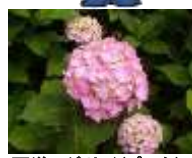
西洋アジサイ(ピンク)