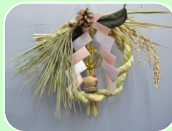
平成28年度参考作品