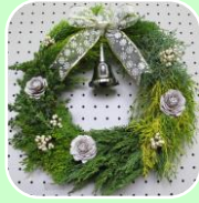
平成28年度参考作品