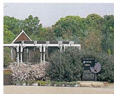
クィーンズランド庭園

山田池に面した水辺広場では、お天気の良い日にお弁当を食べたり、のんびりと昼寝などが楽しめます。