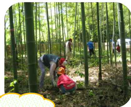
竹林から 春日山を臨む