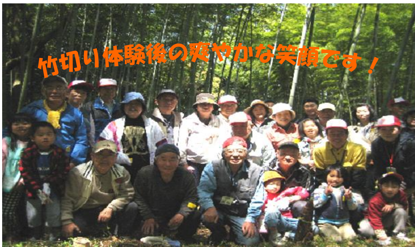
竹切り体験後の爽やかな笑顔です！

主催 ハートフル山田池 山田池公園管理事務所 協力 山田池公園ボランティア ゆうゆう自然クラブ