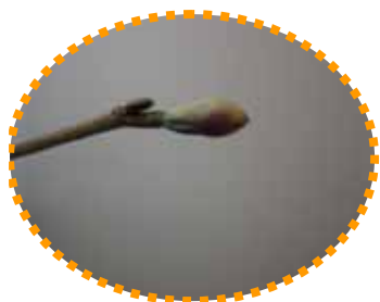
トサミズキの葉芽と花芽